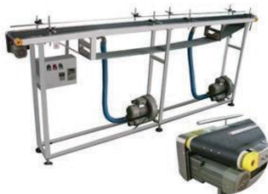
В вакуумной конвейерной упаковке