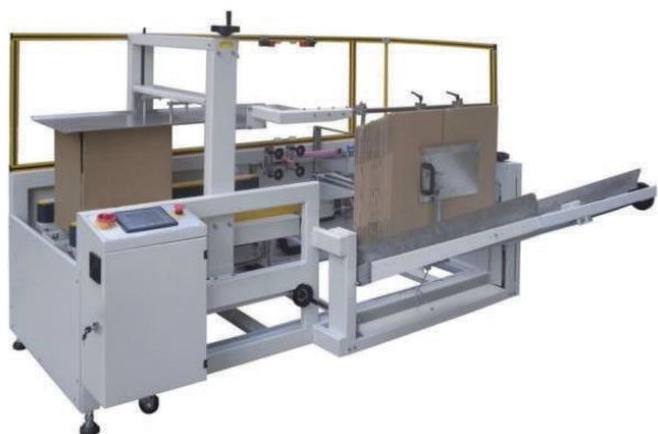
В линиях для производства картонной упаковки